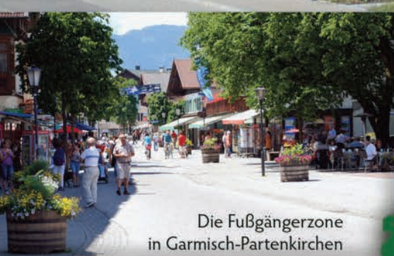
Die Fußgängerzone in Garmisch-Partenkirchen